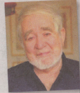
אותב וכואב זך